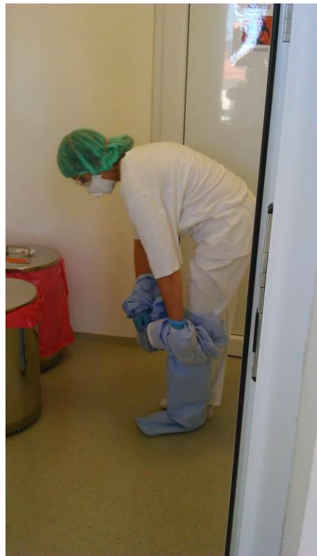
Mjere zaštite pri zbrinjavanju bolesnika inficiranih 2019-n-koronavirusom, Klinika za infektivne bolesti „Dr. Fran Mihaljević“, Zagreb, siječanj 2020.